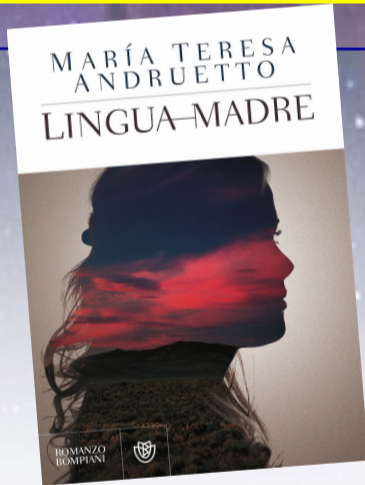
MARIA TERESA ANDRUETTO "Lingua Madre" (Un saluto dall'Argentina VIDEO REGISTRATO)